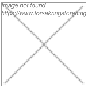
image not found https://www.forsakringsforeningen.se/files/karin_dellby_webb.png