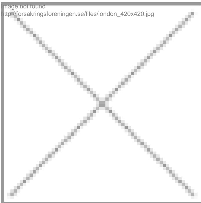
image not found http://forsakringsforeningen.se/files/london_420x420.jpg