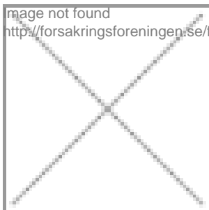
image not found http://forsakringsforeningen.se/files/erik_odlund_webb.png