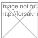
image not found http://forsakringsforeningen.se/files/london_420x420.jpg