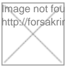
image not found http://forsakringsforeningen.se/files/london_420x420.jpg